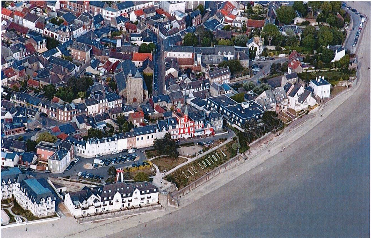
Vue aérienne du centre-ville