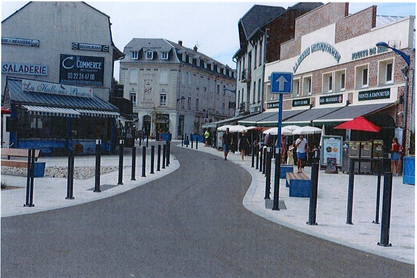
Place Jeanne d'Arc

Face à un risque d'appauvrissement quantitatif et qualitatif de l'offre commerciale de proximité dans le centre-ville nécessitant d'être mieux diversifiée, instaurer un droit de préemption sur les fonds artisanaux, les fonds de commerces, les baux commerciaux et les terrains faisant l'objet de projets d'aménagement commercial, permettra à la municipalité d'avoir une visibilité sur les transmissions et les cessions, lui donnant ainsi la possibilité de préserver la diversité commerciale et artisanale de l'intra-muros et son pourtour.