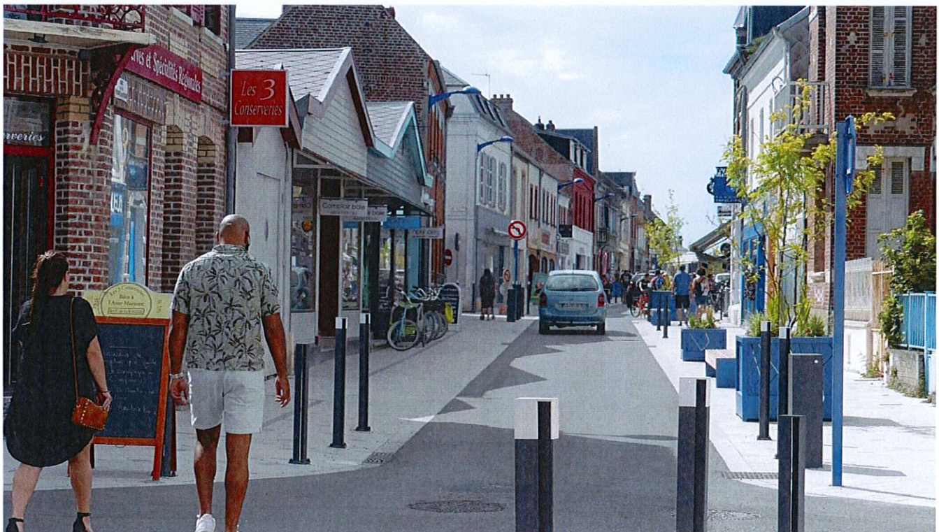
Partie de la rue de la Porte du Pont, artère principale de la ville